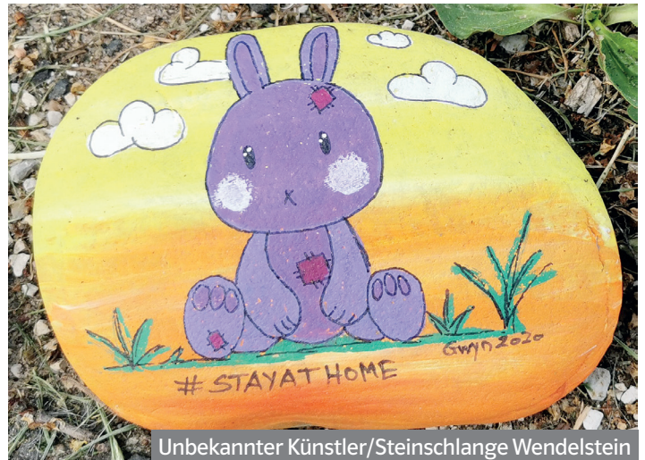
Unbekannter Künstler/Steinschlange Wendelstein

In der aktuellen Zeit müssen wir mit Abstand zusammenhalten. Bleiben Sie gelassen, schenken den Tatsachen ihre Aufmerksamkeit und haben Sie weiterhin Vertrauen in die Maßnahmen.