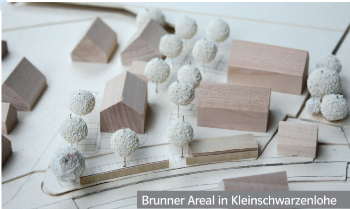
Brunner Areal in Kleinschwarzenlohe

Wir benötigen dringend Wohnraum für Wendelsteiner Familien. In einigen Projekten sind wir bereits auf einem guten Weg.