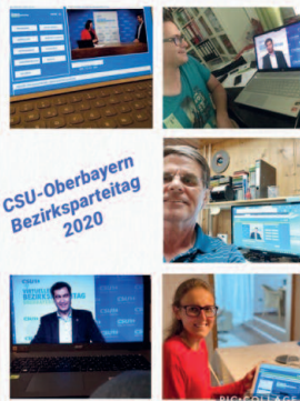
CSU-Oberbayern Bezirksparteitag 2020