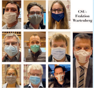
CSU- Fraktion Wartenberg