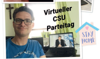
Virtueller CSU Parteitag