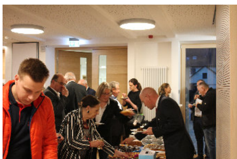
Bei Kaffee, Kuchen und Häppchen klang der Nachmittag gemütlich aus