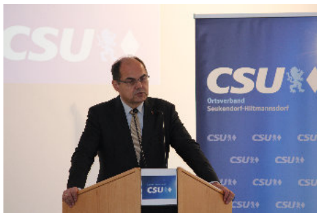
Grußwort unseres Bundesministers a.D. Christian Schmidt