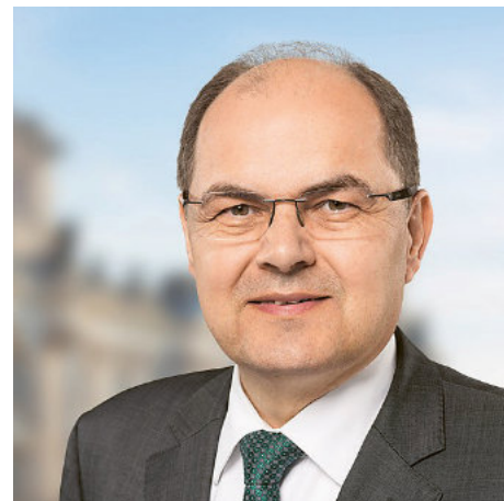
Bundesminister a.D. Christian Schmidt MdB

Darüber hinaus hat die Koalition weitere wichtige Beschlüsse im Bereich Rente, aber auch in der Pflege und Gesundheitsversorgung getroffen. Das Rentenpaket bringt Verbesserungen etwa für Frührentner. Die Mütterrente für vor 1992 geborene Kinder wurde erhöht sowie das aktuelle Rentenniveau und die Haltelinie beim Beitragssatz abgesichert. In den vergangenen zehn Jahren gab es hohe Rentensteigerungen, im Westen um 20 Prozent und im Osten sogar um 30 Prozent. Ein ganz besonderes Anliegen war uns das Sofortprogramm Pflege. Hier werden 13.000 neuen Stellen für Pflegekräfte in Krankenhäusern und Pflegeheimen geschaffen. Zudem haben wir die Ausbildung der Pflegeberufe reformiert, das heißt, das Schulgeld wurde abgeschafft, stattdessen erhalten Auszubildende eine Vergütung. Durch das Terminservice- und Versorgungsgesetz erhalten