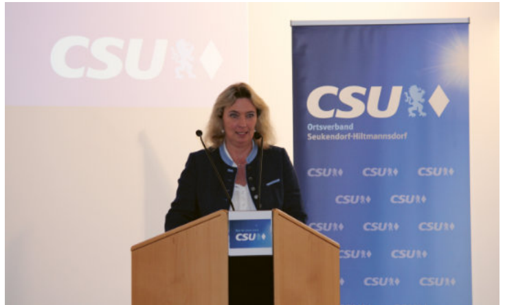
Wir freuten uns, Staatsministerin für Familie, Arbeit und Soziales in Bayern Frau Kerstin Schreyer als unsere Hauptrednerin begrüßen zu dürfen.