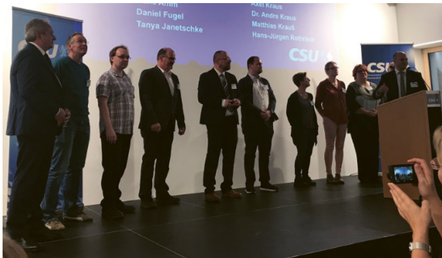
Wir nutzten die Gelegenheit, unsere Gemeinderatskandidaten vorzustellen