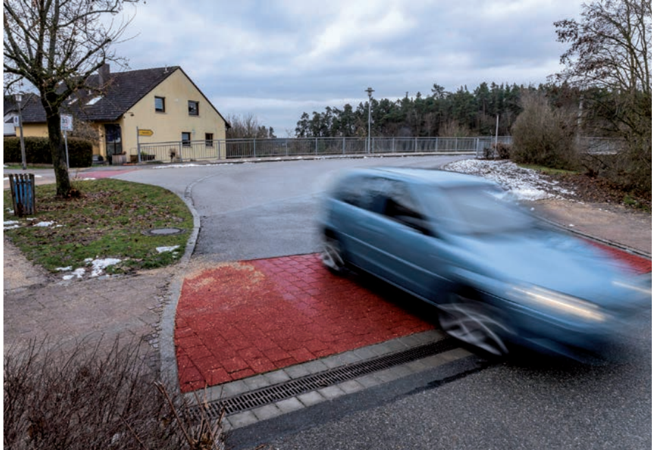
Zukünftig werden zwei rote Bereiche die Fußgängerübergänge im Bereich Ohmstraße/Schwabacher Straße markieren. Unsere Bildmontage stellt diesen Effekt bereits dar.

Die Baumaßnahmen wurden im Oktober abgeschlossen, die farbliche Markierung fehlt aber noch. Laut Bauamt kann diese erst bei einer konstanten Temperatur über 7 Grad aufgebracht werden.