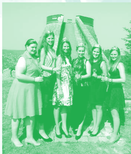
Weinprinzessinnen zur Eröffnung "Magische Orte", Sonnenstuhl 2016, Foto: Anna Adelman

2016 Randersacker Ewig Leben Traminer Kabinett 2,00 0,75 l 13,50