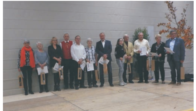
Die Geehrten für 40 Jahre Mitgliedschaft

Ihnen wurden eine Urkunde und das Ehrenzeichen in Silber mit Gold des BLSV überreicht