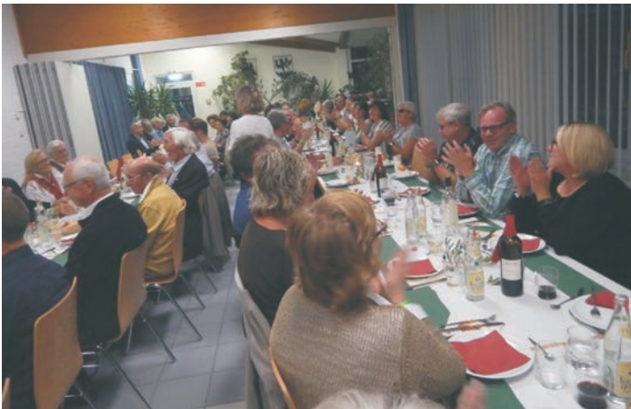
Tischgespräche in freudiger Erwartung

Die meisten Zutaten, wie Wein, Käse, Salami usw. kamen aus unserer Partnergemeinde Castelnuovo Berardenga.