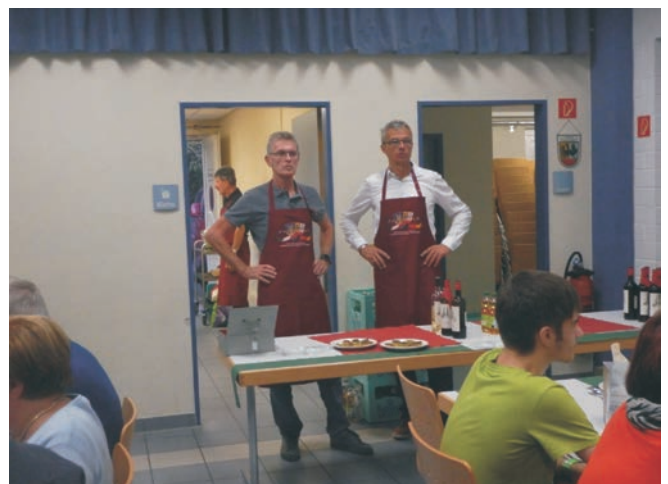
Hier die Zuständigen bei den Getränken