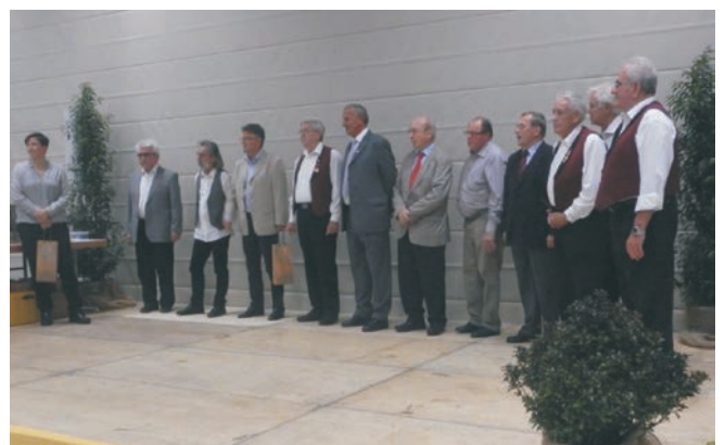
Die Geehrten für 50 und 60 Jahre Mitgliedschaft

Auch sie bekamen eine Urkunde und das Ehrenzeichen in Gold des BLSV