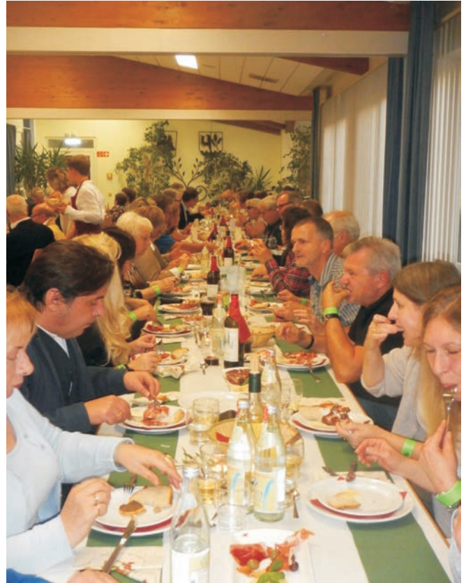
Es ist serviert, guten Appetit