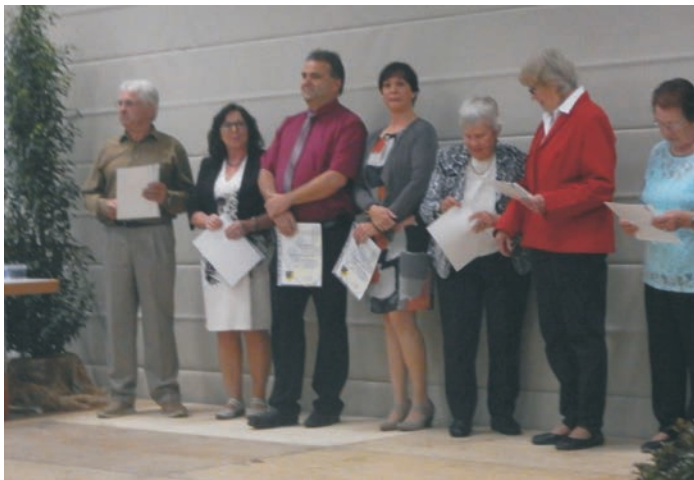
Die Geehrten für 25 Jahre Mitgliedschaft

Die Geehrten wurden mit der Vereinsnadel und der Urkunde des SV Puschendorf ausgezeichnet.