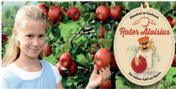
■ Roter Aloisius jetzt erhältlich in Ihrer Gartenbaumschule