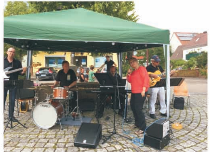
Die Kapelle „Club of Swing“