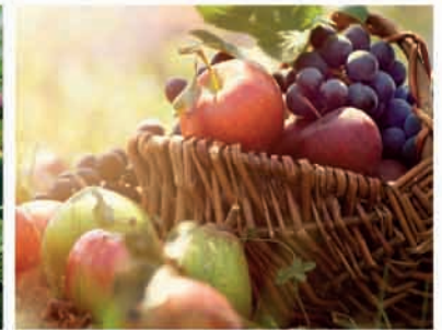
■ Obst und Beeren aus Ihrem Garten