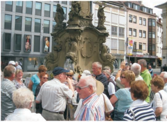
Erklärungen am Vierröhrenbrunnen

Weiter ging's zum Marktplatz mit dem ägyptischen Obelisk und der Marienkapelle, an deren Eingangstür die von Tilman Riemenschneider gefertigten Plastiken von Adam und Eva ins Auge fielen. Erwähnenswert eine Plastik über dem Eingang des nördlichen Portals, wo eine originelle Darstellung der Verkündigung Mariens den Menschen des frühen 15. Jahrhunderts erklärt wurde.