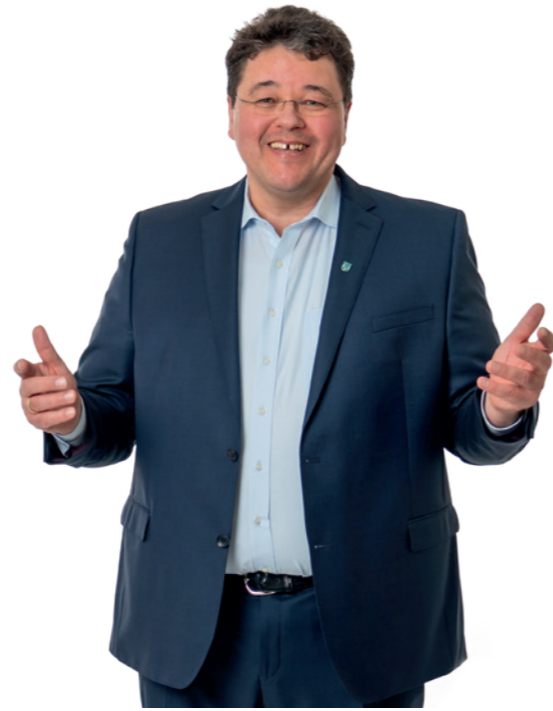
01 THOMAS LODERER seit 2007 Erster Bürgermeister, 50 Jahre, verheiratet, 3 Kinder