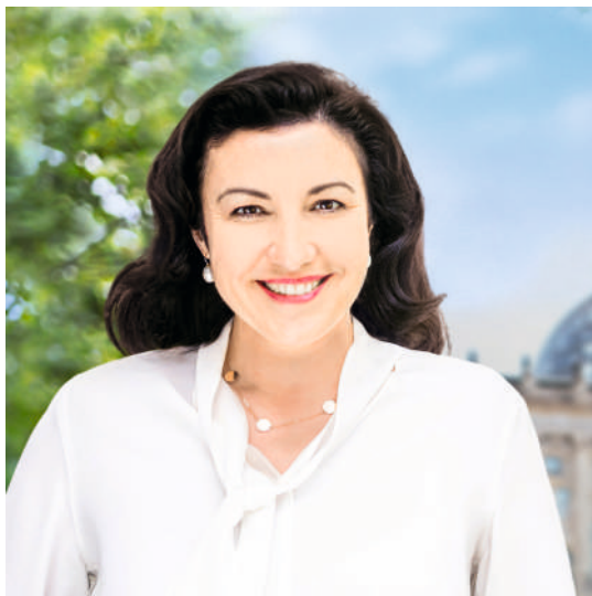
Dorothee Bär ist stellvertretende Fraktionsvorsitzende der CDU/CSU-Bundestagsfraktion für Familie und Kultur. Die Mutter von drei Kindern gehört dem Bundestag seit 2002 an.

Jenseits dieser „Minderheitenpolitik“ gibt es allerdings ein Projekt, das die grüne Bundesfamilienministerin gerne als ihr familienpolitisches Flaggschiff verkauft: die Kindergrundsicherung. Sie droht im Lichte des Dauerstreits der Koalitionäre krachend zu scheitern. Zu Recht. Das Vorhaben ist aus meiner Sicht vor allem eine teure Verwaltungsreform, bietet aber leider keine Antwort auf Kinderarmut in unserem Land. Im Gegenteil, nach allem, was wir wissen, bedeutet sie mehr Bürokratie für die Familien, die aber am Ende keinem Kind nachhaltig helfen wird. Für uns als Union gilt: Kinderarmut ist Elternarmut, ist Bildungsarmut. Deshalb haben wir als Gegenentwurf ein echtes Kinderzukunftsprogramm aufgelegt. Mit zehn zielgerichteten Maßnahmen legen wir den Fokus auf eine Ausweitung der Betreuungs- und Bildungsinfrastruktur statt auf eine Ausweitung von Transferleistungen oder deren Verwaltung. Unser erklärtes Ziel ist, allen Kindern in unserer Gesellschaft – unabhängig von Migrationsgeschichte oder sozialer Herkunft – ein Umfeld zu schaffen, in dem sie ihr volles Potential entfalten können. Das gelingt uns dann am besten, wenn die Eltern in Arbeit sind, so dass perspektivisch weniger Menschen überhaupt auf den Sozialstaat angewiesen sind. Wer sein Leben einmal selbst in die Hand nehmen will, braucht eine gute Kindheit. Dort, wo die Eltern diese nicht ausreichend bieten können, muss die Gemeinschaft unterstützen. Das nenne ich eine moderne Familienpolitik im Stil der Union.