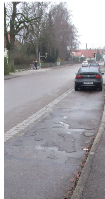
Auch die Parkstreifen gleichen teilweise einem Fleckerlteppich auf dem sich riesige Pfützen bilden.