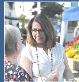
Tanja Schorer-Dremel Landtagsabgeordnete