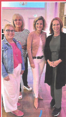
Daniela Ludwig, MdBundestags

Wir Damen der Frauen-Union gestalten selbstverständlich auch die politische Landschaft mit. Wussten Sie, dass für die meisten unserer weiblichen Landtags- und Bundestagsabgeordneten die politische Karriere in der Frauen-Union begann? Wie z.B. für: