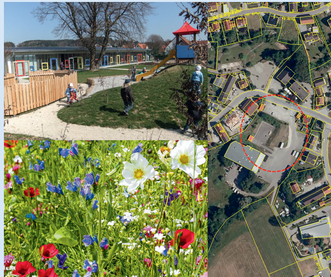
Kindergartenerweiterung – Neue Ortsmitte – Blühwiese