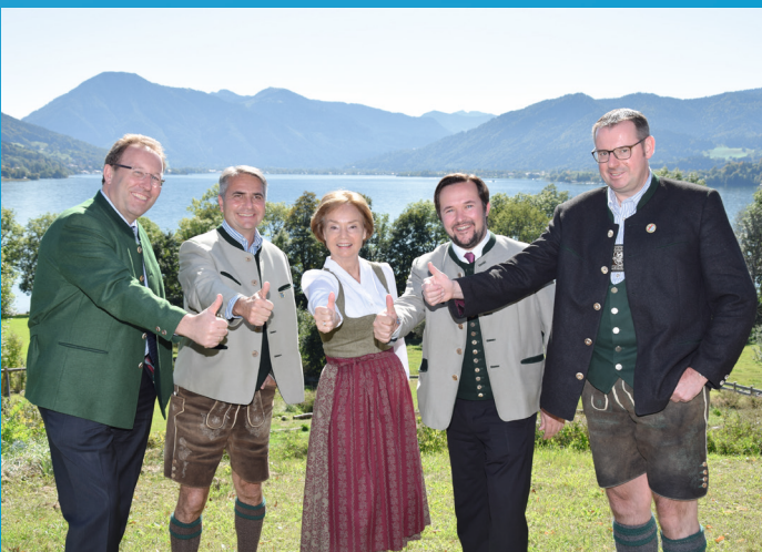
CSU Ortsvorsitzende im Tegernseer Tal

Gemeinsam mit Ihnen möchte ich die Zukunft von Bad Wiessee gestalten. Zögern Sie nicht mich zu kontaktieren: