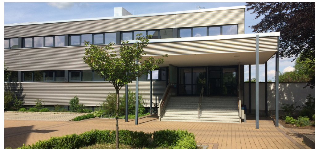
Hallenbad: Außen saniert, Innen dringender Handlungsbedarf

Deshalb spricht sich unsere CSU/JL-Fraktion schon lange für eine kurzfristige Sanierung des Hallenbades aus. Wie mehrfach berichtet, hat diese für uns eine sehr hohe Priorität. Doch die Sanierung war bisher weder im Haushalt 2016 noch im Finanzplan der drei Folgejahre vorgesehen. Nur für die Planung der Sanierung sind Mittel im Fi-