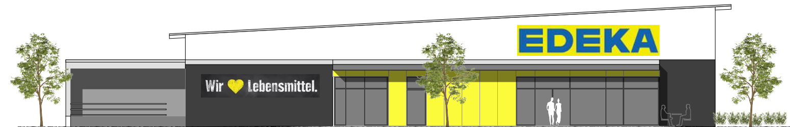
Westansicht des geplanten EDEKA-Neubaus am Josef-Dunau-Ring

Die wichtige Botschaft zuerst – der EDEKA-Markt bleibt uns erhalten. Er bleibt uns nicht nur erhalten, er wird komplett neu gebaut und deutlich größer und moderner gestaltet. Damit ha-