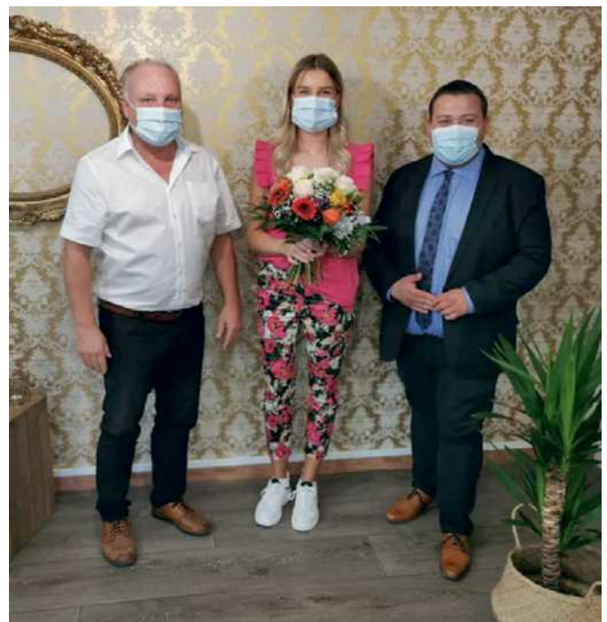
Bürgermeister Sebastian Bernhard gratuliert zur Eröffnung eines lokalen Gewerbebetriebs

Neustrukturierung der Verwaltung, Modernisierung der Datenverarbeitung und schrittweise Umstellung auf elektronische Aktenführung sowie digitalen Bürgerservice