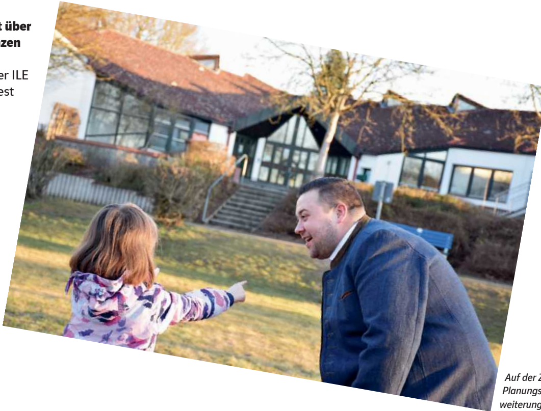
Auf der Zielgeraden: die Planungsarbeiten für die Erweiterung der Grundschule