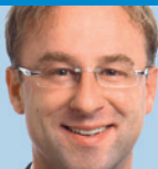
Wolfgang Fackler, MdL Vorsitzender des Ausschusses für Fragen des öffentlichen Dienstes