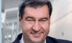
Dr. Markus Söder, MdL Vorsitzender der CSU Bayerischer Ministerpräsident