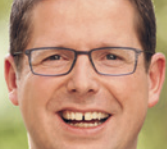
Stephan Stracke, MdB Stellvertretender Vorsitzender der CDU/CSU-Bundestagsfraktion