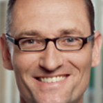
Bernhard Seidenath, MdL Landesvorsitzender des GPA und Vorsitzender des Ausschusses für Gesundheit und Pflege im Bayerischen Landtag