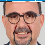
Klaus Holetschek, MdL Staatsminister für Gesundheit und Pflege