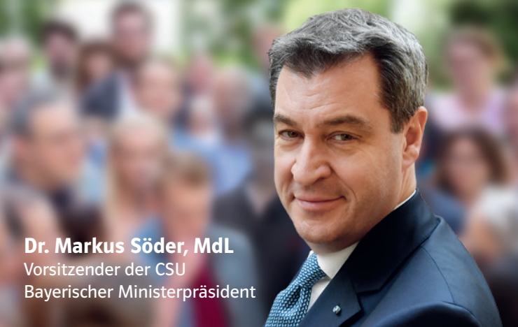
Dr. Markus Söder, MdL Vorsitzender der CSU Bayerischer Ministerpräsident

Sehr geehrte Damen und Herren, die bäuerliche Landwirtschaft ist die Seele Bayerns. Sie ist kleinteilig, vielfältig und innovativ. Sie produziert hochwertige, regionale Lebensmittel. Dies möchte ich auch für die Zukunft erhalten!